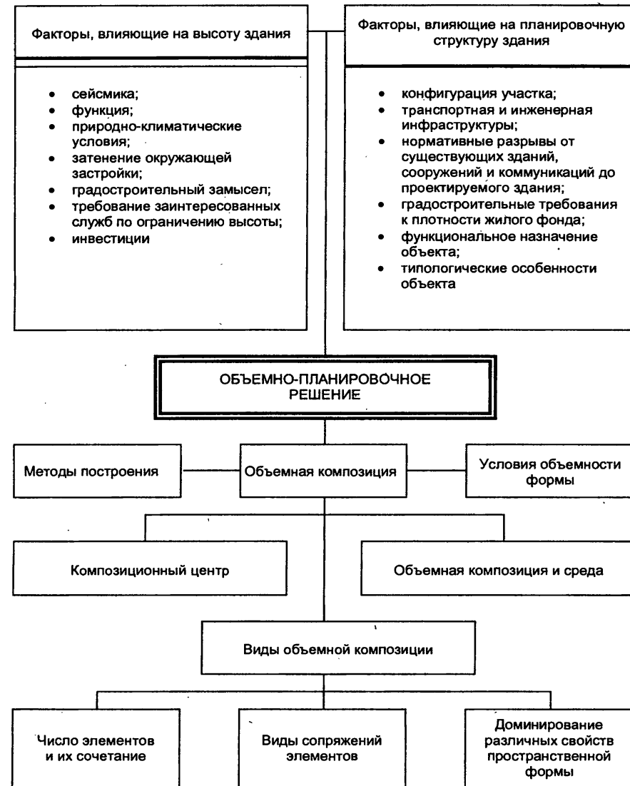
Рис. 2. Разработка объемно – планировочного решения